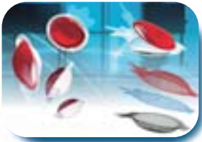
Confection à 2-secteurs