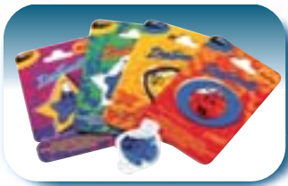
Deux lignes, côte plat (ligne Magic)